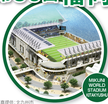
MIKUNI WORLD STADIUM KITAKYUSHU